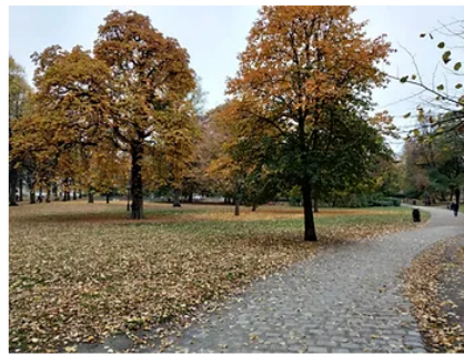
עלי סתיו - צלם בעז זלמנוביץ [שטוקהולם]

והנה צ'אפק בקטע המתאים לקורא הספרים שהצליח להגיע עד לכאן בפוסט והעוסק בהתאמת הקריאה לעיתוי - 'מה קוראים מת' , והמופיע באתר ההוצאה: "אחת השאלות הקבועות שאנו מטרידים בהן לעתים את הקרובים לנו, היא: "מה הספר האהוב עליך?" כמו רוב השאלות מן המוכן, גם זו אינה מדויקת לגמרי. היה נכון יותר לשאול: "מה הספר האהוב עליך בסיטואציה כזו וכזו?". טוב.