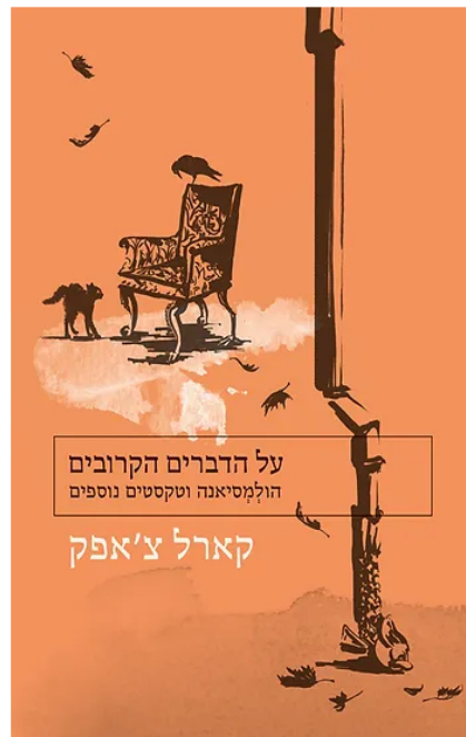
שער 'על הדברים הקרובים' של קארל צ'אפק